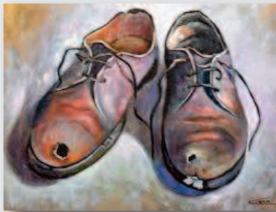
Espectacle estrenat a la sala La Planeta de Girona i a l'espai Brossa La Seca de Barcelona

L'actriu Sílvia Bel, acompanyada de la Llúcia Vives a la veu i el piano de Carles Beltran, es capbussen dins la història més fosca i viva de la literatura, l'obra dels poetes “maleïts”.