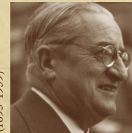
CARLES RIBA Salvatge cor, 1 QUE EN EL CANT SIGUI BAIX EL BES