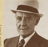
J.V. FOIX Sol i de dol